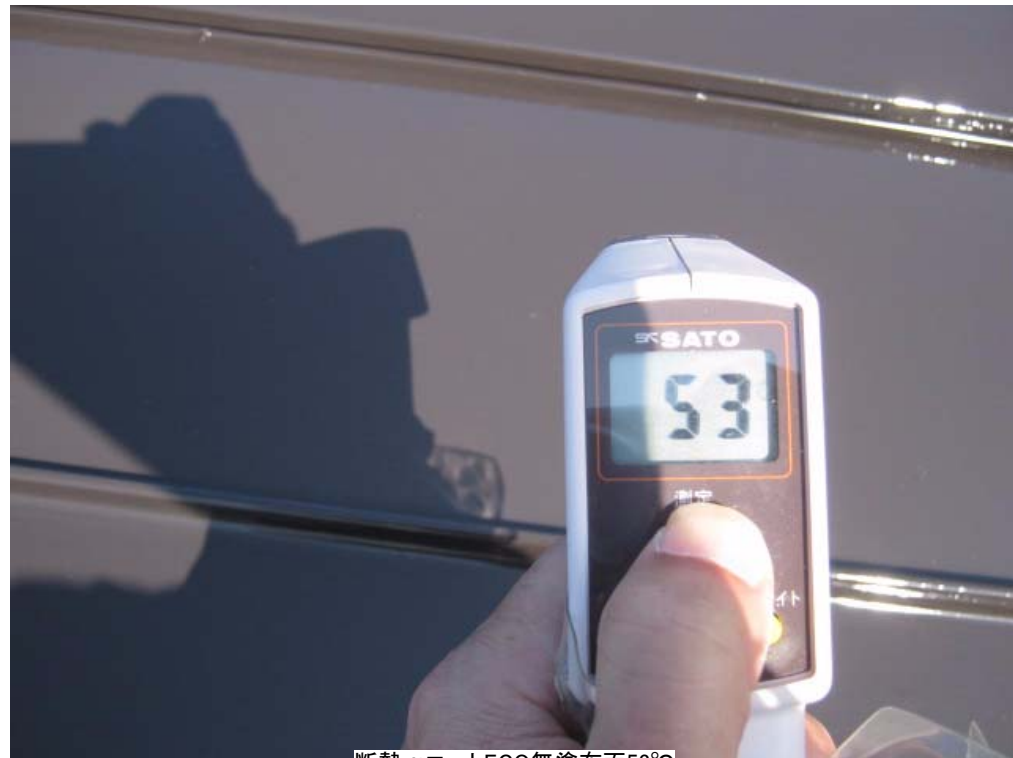
断熱 \alpha コートECO無塗布面53°C