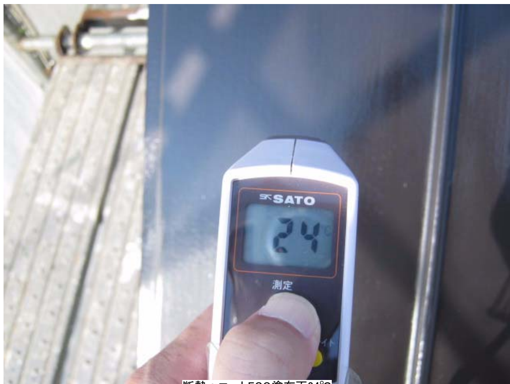
断熱 \alpha コートECO塗布面24°C