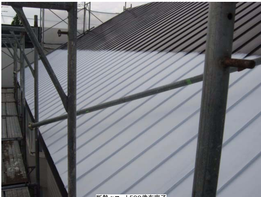
断熱 \alpha コートECO塗布完了