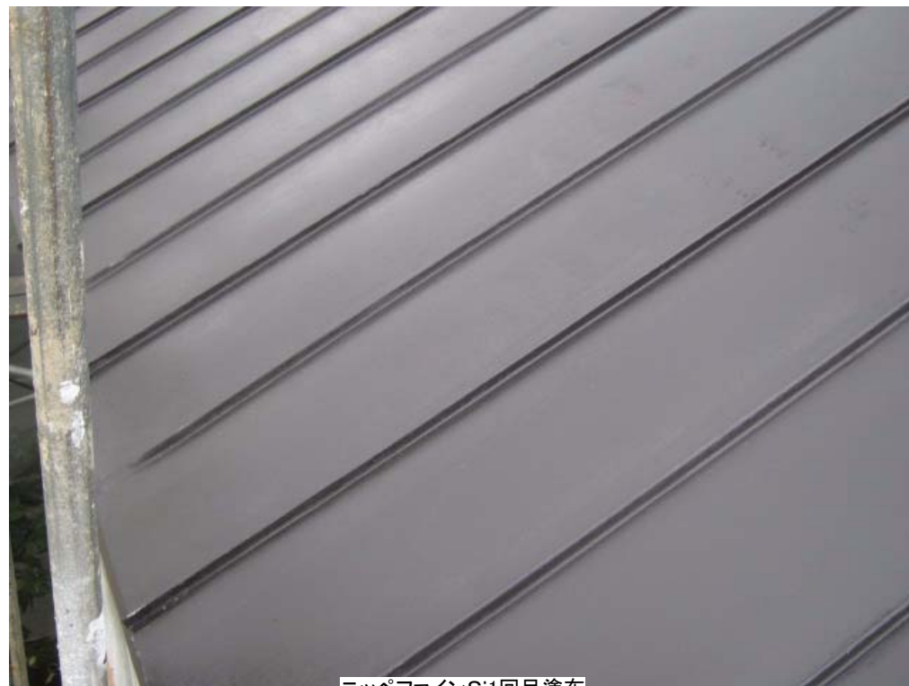
ニッペファインSi1回目塗布