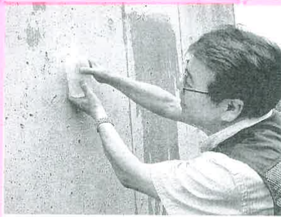
コンクリート表面に遮水層を作り、水を強力にはじく

ケイ酸塩系のSクリートアップと、シリラン・シロキサン系のSクリートガードを重ね塗りして施工する。コンクリート構造物の遮水・防水のほかに、塩害や凍害、白華、アルカリ骨材反応、中性化の抑制に効果がある。鉄筋の腐食を防いだり、カビや藻が付くのを防ぐ機能も持つ。